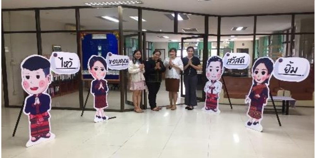
สร้างค่านิยมให้มีมารยาทแบบไทย