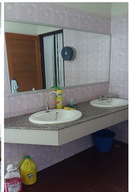
มีห้องน้ำที่สะอาด ถูกสุขลักษณะ