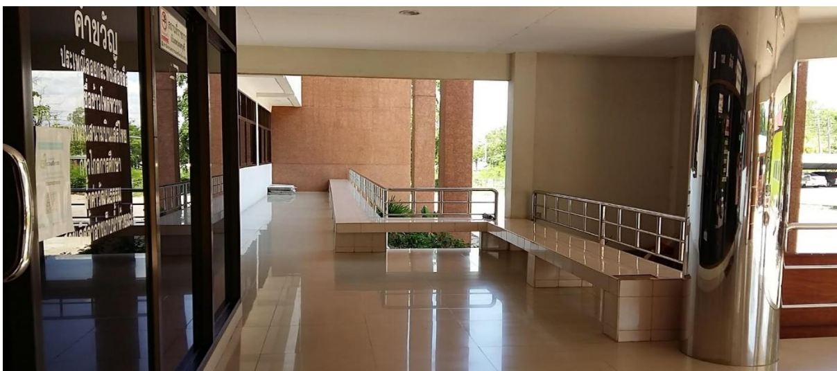
มีระเบียบหน้าสำนักงานให้พักผ่อนหย่อนใจ