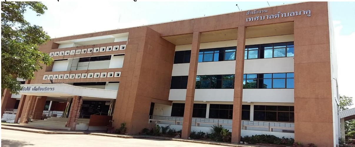
บริเวณสำนักงานสะอาด เป็นระเบียบเรียบร้อย

เสริมสร้างสภาพแวดล้อมในการทำงานให้สะอาด เป็นระเบียบเรียบร้อย ถูกสุขลักษณะ ทำให้บุคลากรมีความสุข ฟังพอใจ และมีแรงจูงใจในการทำงาน