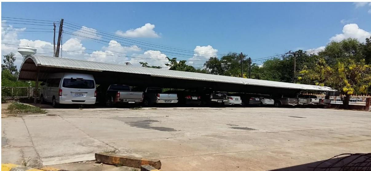
มีโรงจอดรถที่ได้มาตรฐาน